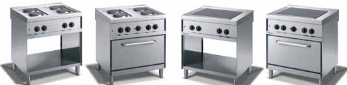
Piani cottura Elettrici con piastre tonde e vano a giorno