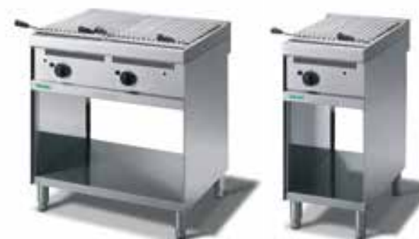
Griglie Gas a pietra lavica