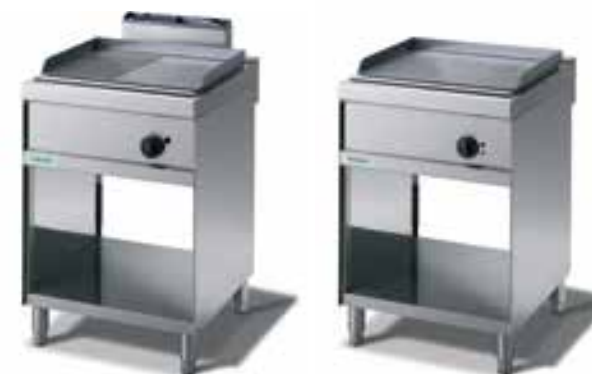
Fry-top Gas/Elettrici lisci, rigati, misti