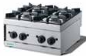
Piani cottura Gas