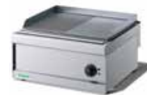
Fry-top Elettrici lisci, rigati, misti