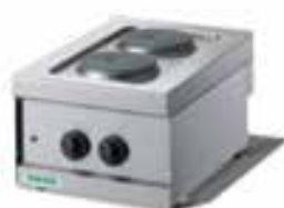
Piani cottura Elettrici con piastre tonde