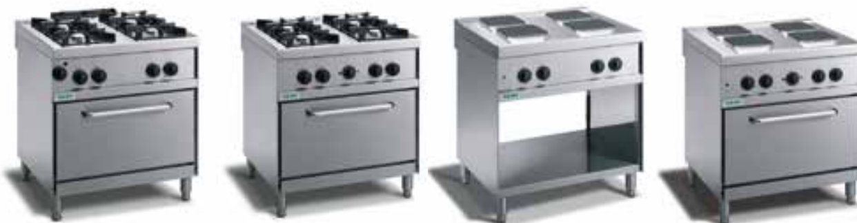
Cucine a Gas con fiamma pilota e forno gas