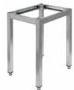
Telai di sostegno