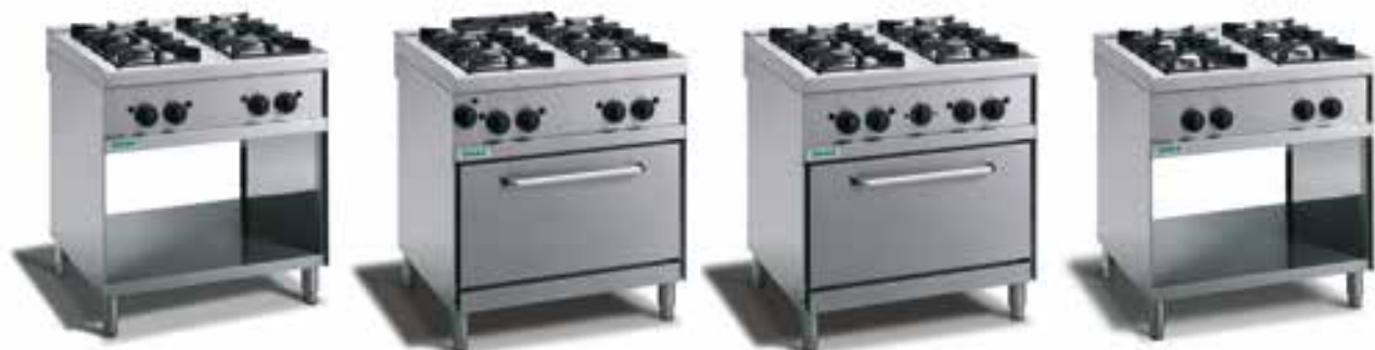
Piani cottura a Gas con vano a giorno